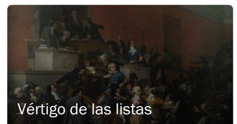
Vértigo de las listas