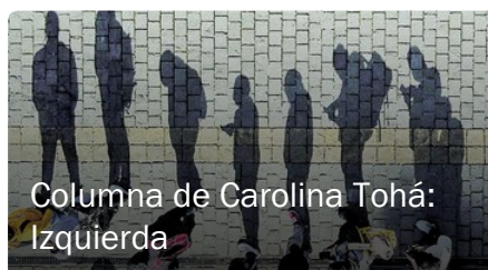
Columna de Carolina Tohá: Izquierda